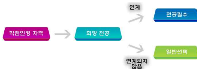
[그림 3] 자격 학습구분 결정 기준