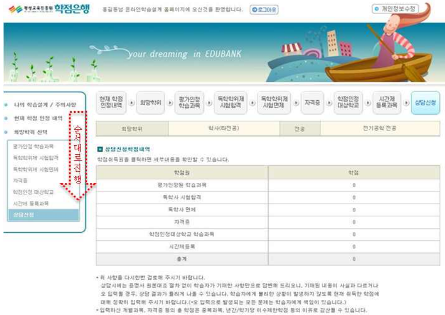
[그림 12] 온라인 학습설계 시스템