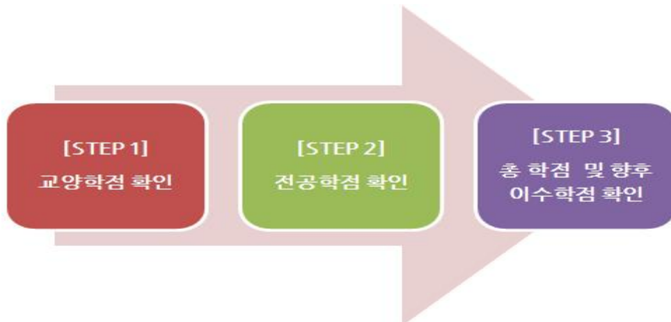
[그림 4] 학점은행제 학습설계 순서도