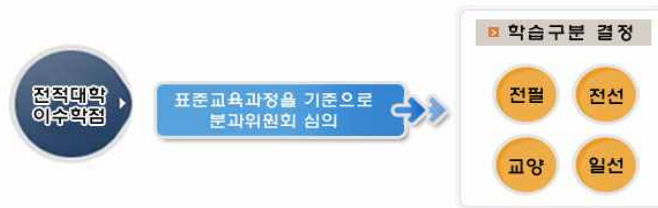
[그림 7] 학점인정대상학교 학습구분 결정 기준