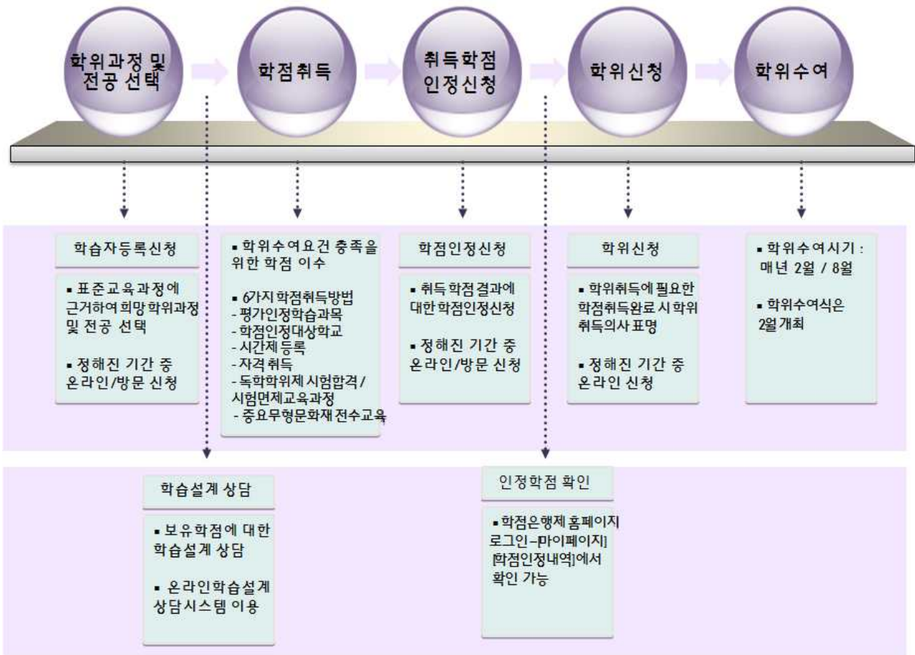
[그림 1] 학점은행제 흐름도

□ 일반적으로 아래와 같은 절차로 학점은행제 학위과정을 진행할 수 있습니다.